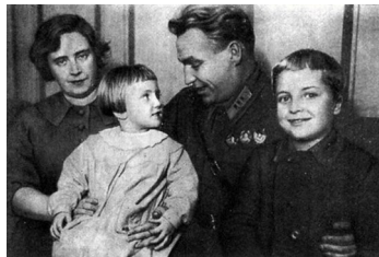
Валерий Чкалов с семьей

дослужился до звания полковника. Кстати, и супруга, и сын написали много статей и несколько книг о своём великом родственнике.