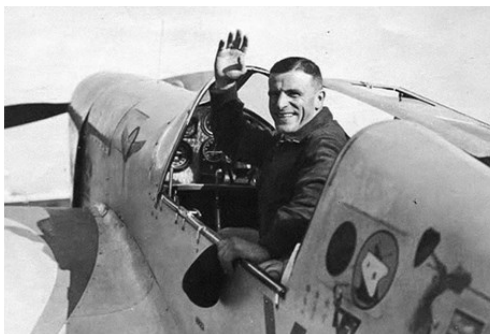
Герой Советского Союза Валерий Чкалов

В голове Чкалова словно что-то щёлкнуло, и он стал мечтать связать свою жизнь с летательными аппаратами. В 15 лет Валера, благодаря тому что добровольно вступил в ряды Красной Армии, стал учеником слесаря при военном авиационном заводе.