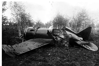
Место гибели Валерия Чкалова

В конце осени 1938 года Валерий Чкалов находился в заслуженном отпуске, из которого его неожиданно отозвали. Были назначены внеплановые и весьма срочные испытания истребителя-новинки «И-180». Тестовый полёт готовился в большой спешке, с нарушением практически всех мер безопасности. Буквально накануне рокового испытания в самолёте было выявлено около 190 серьёзных дефектов.