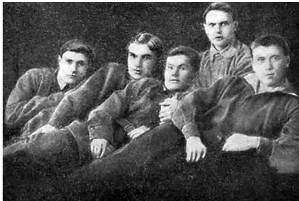
Валерий Чкалов в кругу товарищей – курсантов Борисоглебской летной школы

К урокам Чкалов не проявлял особого интереса, но буквально с первых дней в нём обнаружился талант к математике, а также великолепная память, позволяющая запоминать большое количество информации, услышанной фактически краем уха. После обязательной семилетки Валерий отправился в Череповецкое техническое училище, но окончить подростку не удалось. Из-за отсутствия финансов училище было ликвидировано.